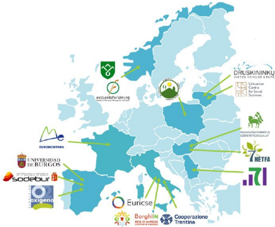
Figura 1. Socios y países del consorcio del proyecto ESIRA