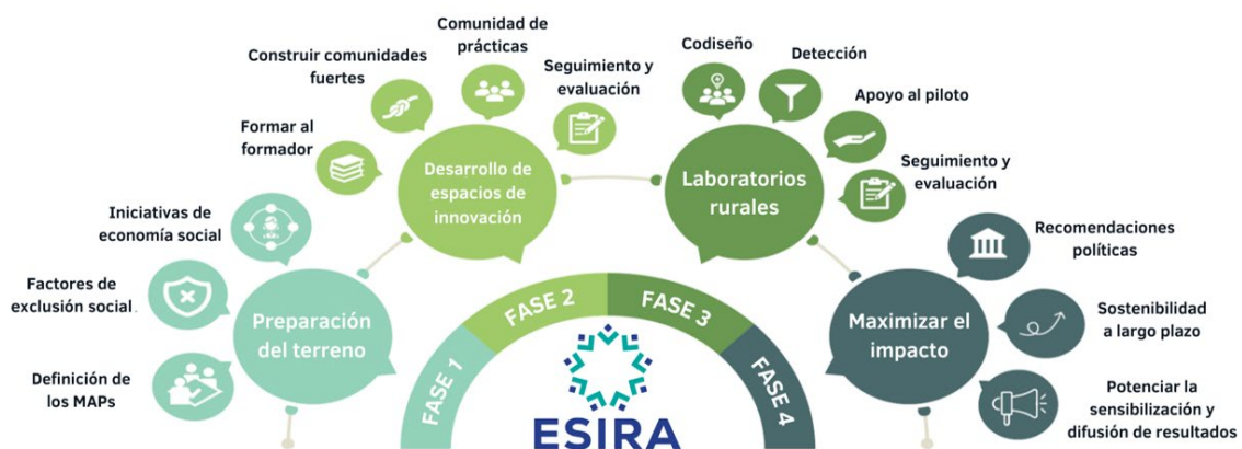
Figura 3. Fases del proyecto ESIRA