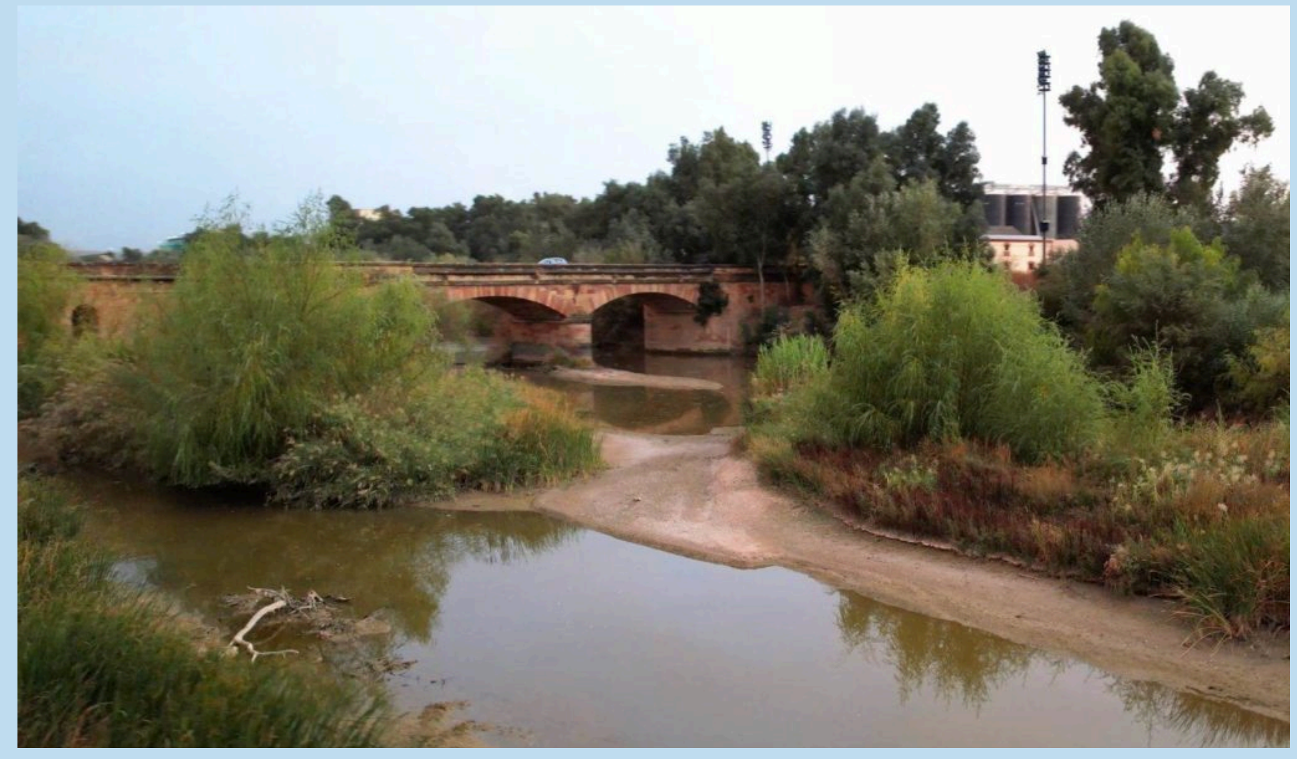
Figura 1. Entorno de la zona de actuación del proyecto

El proyecto Parque Fluvial Orgánico de Andújar: Besando, Abrazando el Guadalquivir , se presenta como una solución ecológica a los problemas históricos de inundaciones que sufre la ciudad de Andújar, mediante la implementación de Soluciones Basadas en la Naturaleza (SBN). A través de estas soluciones, se pretende mejorar la continuidad fluvial y conectividad del río Guadalquivir a su paso por la ciudad.