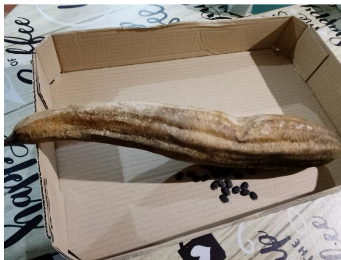
Figura 19. Calabaza esponja y sus semillas.

-Además, se ha encontrado la guarda de orégano que previamente ha sido recolectado en la zona y utensilios de cocina realizados a mano tales como diferentes cucharas realizadas con laurel plantado en el lugar lo que muestra una vez más el vínculo de los hortelanos con el entorno rural en el que viven.