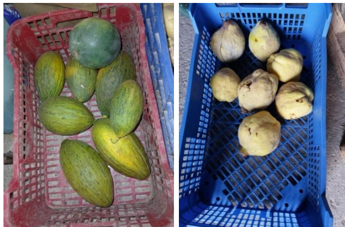
Figuras 13 y 14. Melones y sandía guardados para consumir y membrillos recogidos.

En las imágenes (Figuras 15, 16, 17 y 18) podemos observar la guarda de semillas para algunas ser consumidas durante el año y otras para ser plantadas en la primavera por parte de