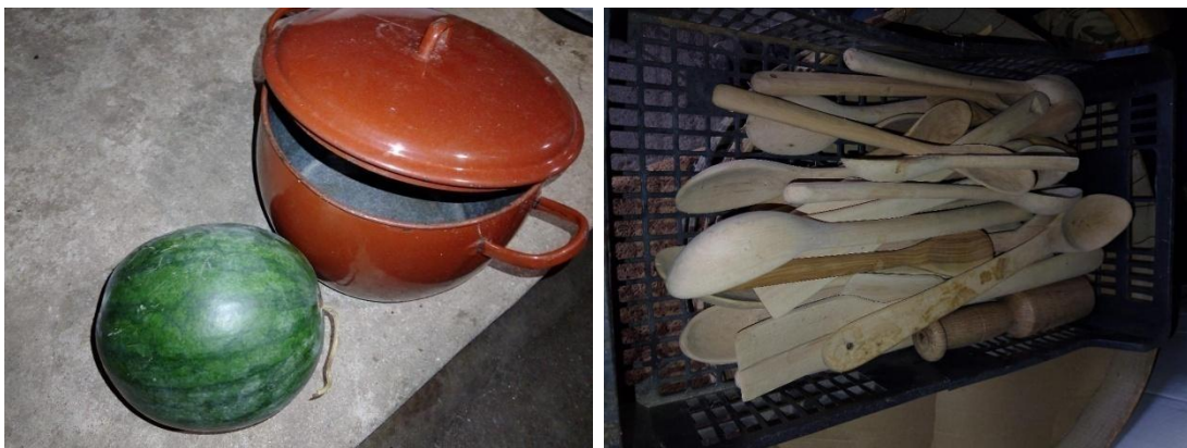
Figuras 9 y 10. Sandía con olla antigua y utensilios de cocina de laurel realizados a mano por un entrevistado. Fuente: Elaboración propia.

habitantes de un lugar sobre las plantas y a través de ella se puede observar el vínculo cultural y potencial de las plantas con los lugareños. Sabiendo esto, en este estudio se ha desarrollado investigación etnobotánica en municipios abulenses con el objetivo de saber más sobre el conocimiento de los habitantes de las zonas rurales sobre variedades locales tradicionales hortícolas y frutales de la provincia de Ávila y el vínculo con dichas variedades y otras, tales como el orégano, que es recogido año tras año por los lugareños de los municipios en los que se ha desarrollado este estudio y conservado en seco par ser consumido en diferentes guisos (Figura 8). En las Figuras 9 podemos observar un fruto de sandía con una olla antigua mostrando la cercanía entre frutos y alimentación y en la Figura 10 diferentes herramientas de madera, para ser utilizados en la cocina, realizadas a mano a partir de tallos de laurel por un entrevistado de este estudio.