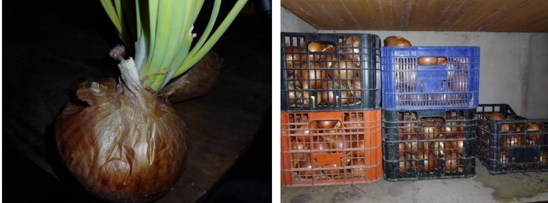
Figuras 4 y 5. Cebollas guardadas durante meses por un entrevistado del estudio realizado para su consumo.

INVESTIGACIÓN ETNOBOTÁNICA Y CONSERVACIÓN DE RECURSOS FITOGENÉTICOS ABULENSES: ESTUDIO SOBRE VARIEDADES LOCALES TRADICIONALES HORTÍCOLAS Y FRUTALES EN EL VALLE DEL TIÉTAR (ÁVILA).