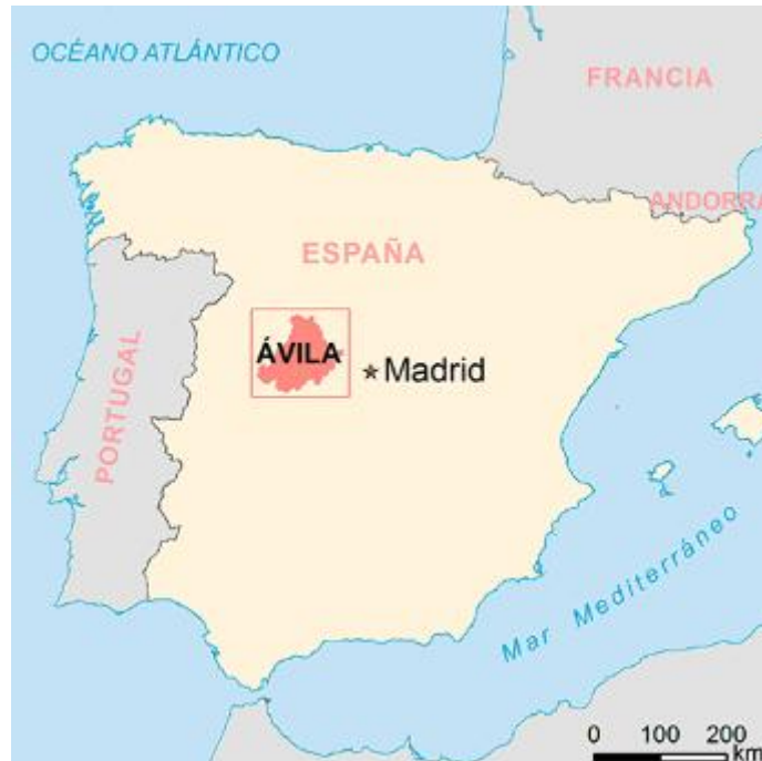
Figura 1. Situación provincia de Ávila. Fuente: Mapa de la provincia de Ávila. https://www.mapasdeespana.com/provincia/mapa-provincia-avila

En este estudio, se han realizado encuestas semiestructuradas en la provincia de Ávila (Figura 1) en los municipios de Piedralaves y Casavieja en el Valle del Tiétar (Figuras 2 y 3), preguntando in situ a horticultores por las plantas hortícolas y frutales locales y tradicionales, descubriendo opiniones, usos y conocimientos sobre dichas variedades. Adentrarse en las poblaciones rurales para conocer en primera persona la sabiduría sobre este tipo de variedades supone recoger información muy valiosa de este conocimiento.