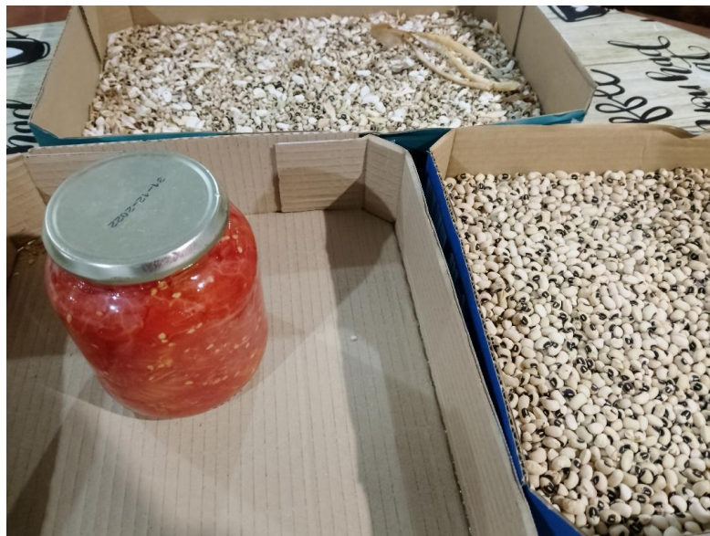
Figura 20. Guarda de semillas para consumo propio y plantación y conserva de tomate para consumo.

En definitiva, se debe subrayar la importancia de mantener y cultivar las variedades que han sido protagonistas en este estudio, pues las variedades locales tradicionales hortícolas y frutales no deben olvidarse. Estas variedades deben ser puestas en valor entre los hortelanos ya que suponen una riqueza genética, cultural, social y de mercado muy interesante para la población rural abulense.