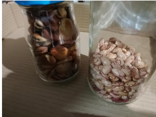
Figuras 17 y 18. Guarda de semillas por los entrevistados de judía carilla y judía pinta y de habas y judía pinta.