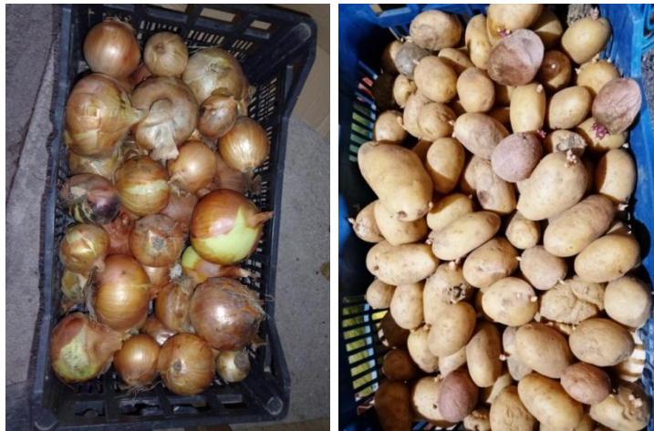
Figuras 11 y 12. Cebollas y patatas guardadas por entrevistados. Fuente: Elaboración propia.

A continuación (Figuras 11, 12, 13 y 14) podemos observar algunos frutos de hortícolas y frutales recogidos y/o guardados por los entrevistados: