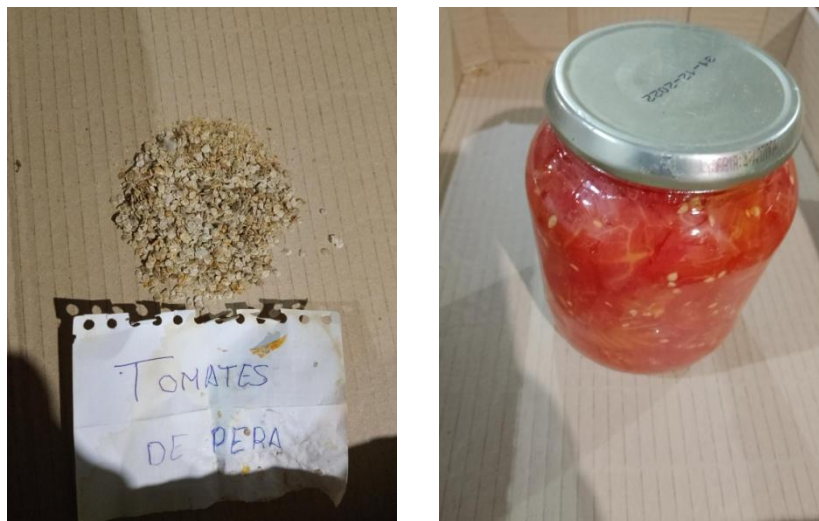
Figura 6 y 7. Semillas de tomate de pera guardadas por un entrevistado y tarro de conserva de tomate realizado por él mismo.

En este estudio se han podido observar y conocer semillas y conservas realizadas por los propios horticultores; como se puede observar en la Figuras 6, los agricultores guardan sus propias semillas año tras año con esmero para luego obtener de ellas frutos valiosísimos para realizar diferentes conservas tales como la conserva de tomate que ha sido protagonista en el Valle del Tiétar durante generaciones (Figura 7).