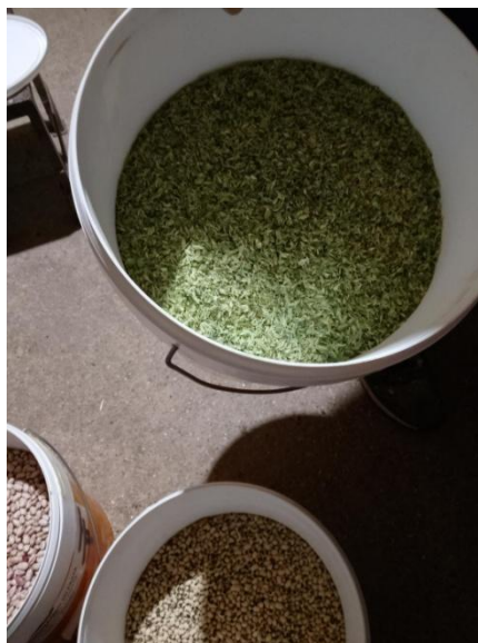
Figura 8. Orégano recolectado del campo y secado por un entrevistado del estudio y guardado para ser consumido durante todo el año.

Desde muchos puntos se están llevando a cabo diferentes iniciativas para la conservación de variedades hortícolas y frutales de zonas concretas. Crear bancos de semillas (de instituciones o comunitarios) en los que se desarrolle un verdadero intercambio supondrá un acercamiento a dichas variedades de forma explícita por parte de los horticultores. Como expone Aragón (s.f.) los bancos comunitarios de semillas nativas se han utilizado como una alternativa por cientos de familias de pequeños agricultores que dieron origen a varios proyectos de desarrollo sustentable. Ya tiempo atrás, Nikolái Ivánovich Vavilov (1887-1943) director del Instituto de Fitocultura (Leningrado, 1921-1940) realizó un programa de recolección de semillas por todo el mundo en el que se obtuvieron 160.000 muestras de más de 50 países y después numerosos países realizaron recolecciones de material vegetal (Mallor, 2018). El almacenamiento en forma de semilla es el preferido para conservar el 90% de los seis millones de accesiones mantenidos en colecciones ex situ en todo el mundo (Rao et al., 2007). Conservar este tipo de semillas supone conservar material genético de valor incalculable.