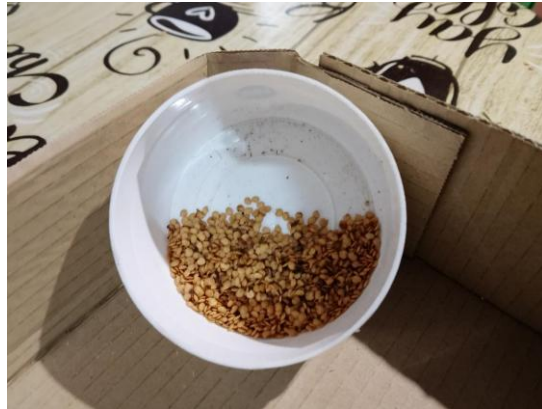
Figuras 15 y 16. Guarda de semillas de judía carilla y de pimiento por los entrevistados.