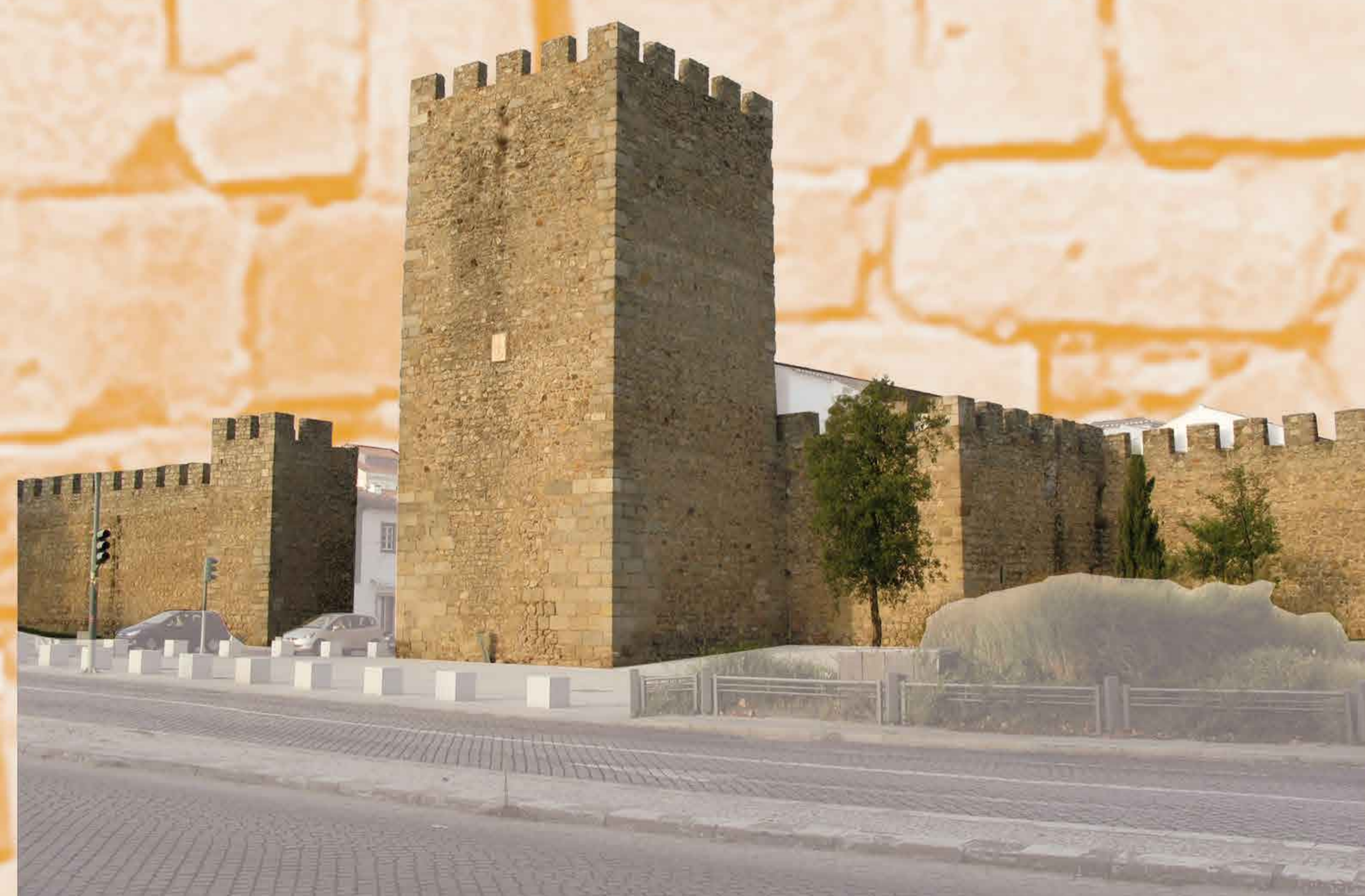
CONJUNTO AMURALLADO DE ÉVORA