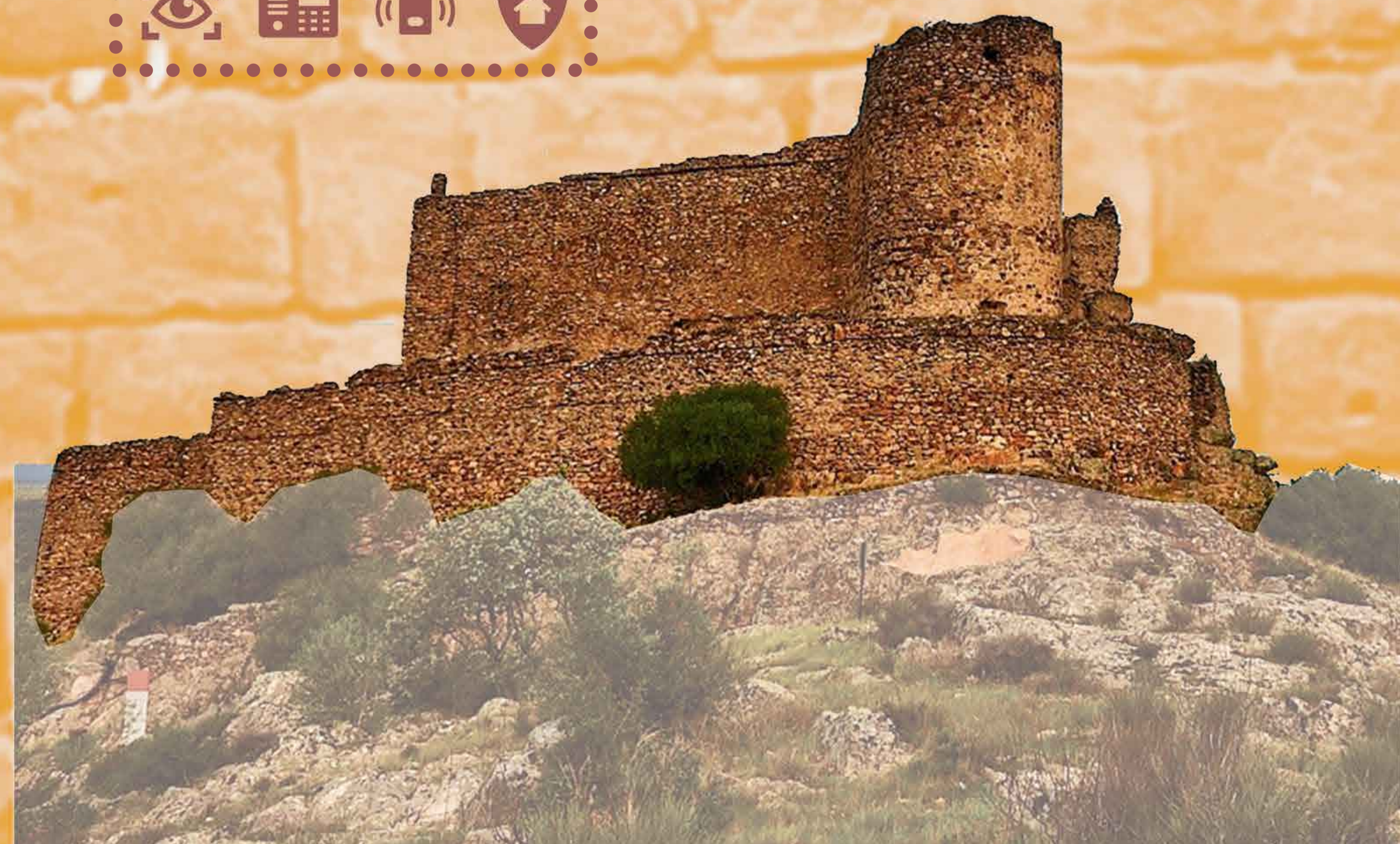
CASTILLO DE PORTEZUELO O MARMIONDA