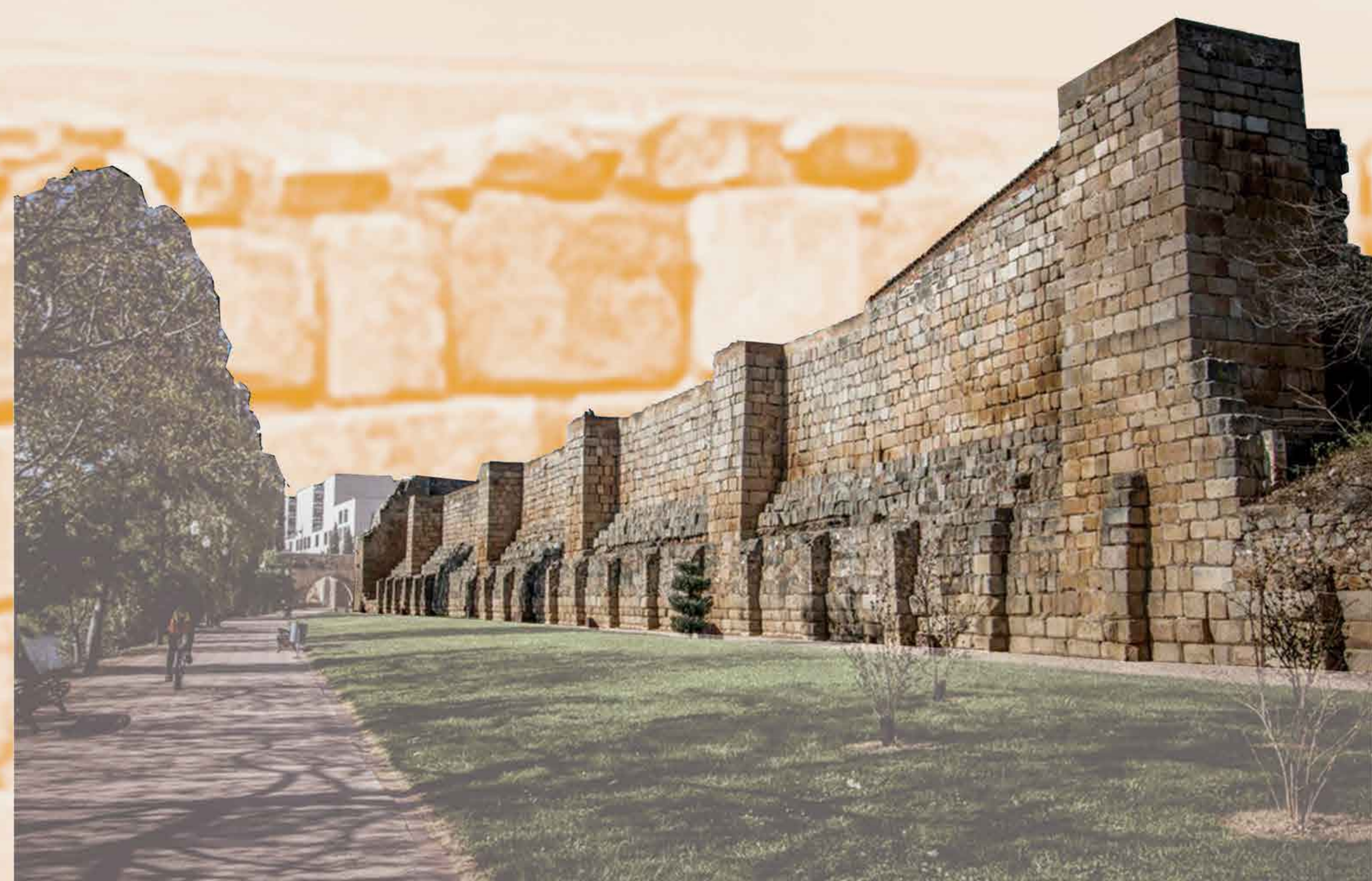
ALCAZABA MUSULMANA DE MÉRIDA

HEPRESTONE es un proyecto europeo transfronterizo de la zona EUROACE cuyo objetivo es identificar y compartir buenas prácticas y medidas innovadoras en favor de la vigilancia y protección del patrimonio cultural, analizando las amenazas dentro de este territorio, con la identificación de los factores de riesgo potenciados por el cambio climático y otras condiciones extremas no naturales, desarrollándose así indicadores críticos de alerta que permitan la monitorización según parámetros predefinidos. Se catalogará toda esta información en bases de datos digitalizadas, que servirán para la creación de gemelos digitales de los monumentos piloto, que sirvan de base para desarrollar las acciones de mantenimiento correctivo, conservación predictiva y gestión turística de estos bienes.