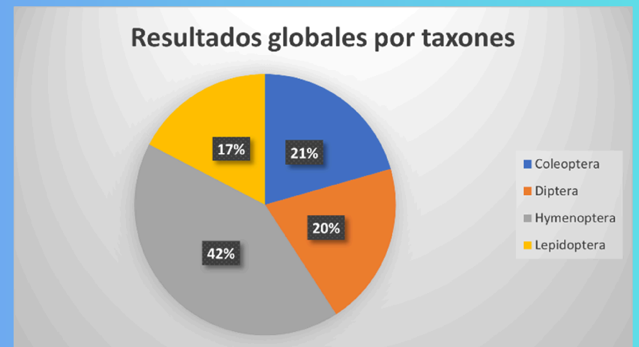
Figura 1. Porcentaje de visualizaciones por grupos de polinizadores

Los datos obtenidos, a pesar de haber comenzado tarde el proyecto este año, son muy interesantes ya que han permitido mapear la ciudad de Alicante con diferentes polinizadores que están agrupados por taxones. Como podemos observar, el grupo mayoritario determinado es himenóptera (abejas), seguido por coleóptera (escarabajos) y díptera (moscas) y con un porcentaje menor de lepidóptera (mariposas) (Figura 1)..