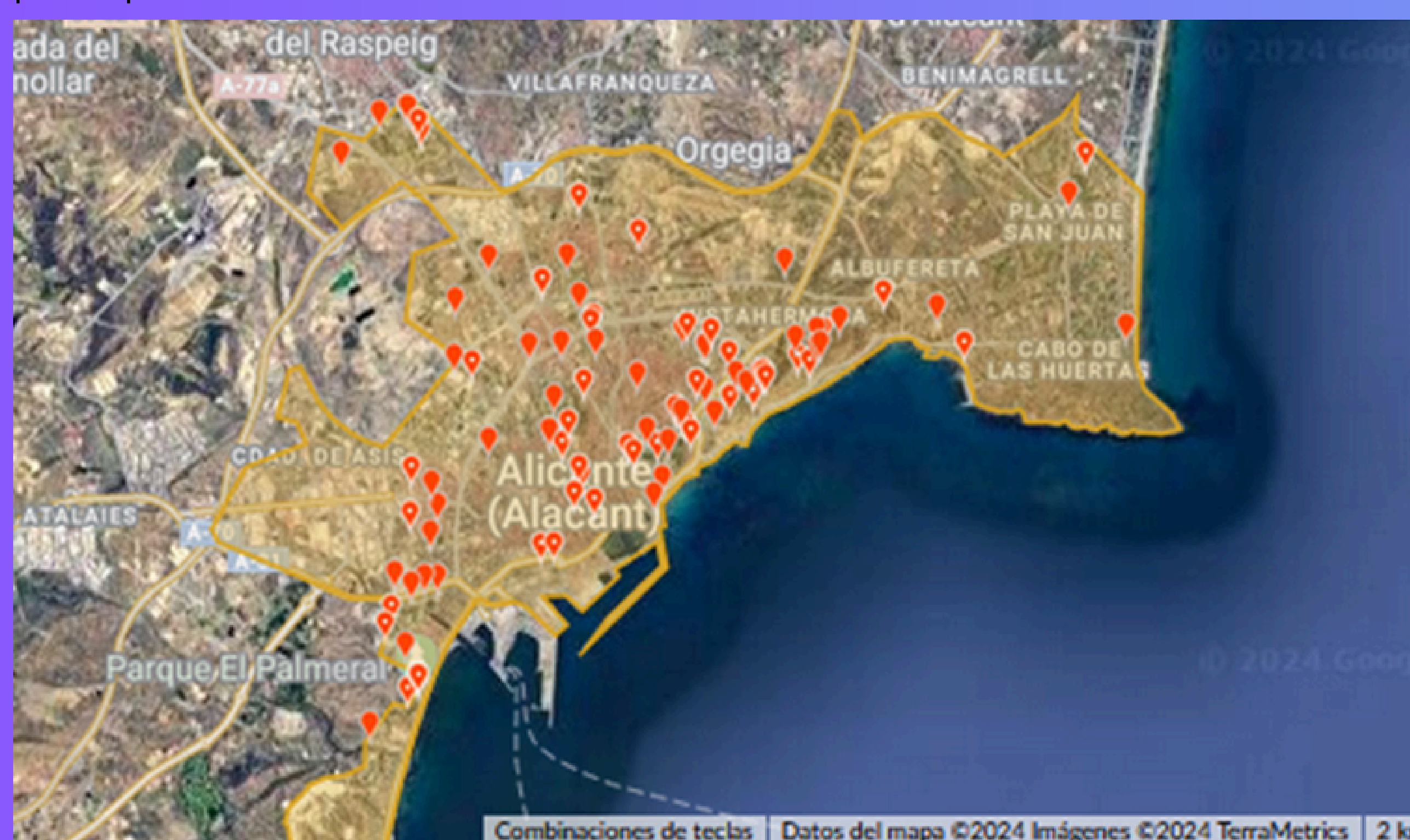
Figura 2. Mapa del proyecto en iNaturalist con las visualizaciones registradas y el área de estudio.

Hasta el momento del análisis había registrados casi 100 observadores con una media de 3,4 observaciones por participante.