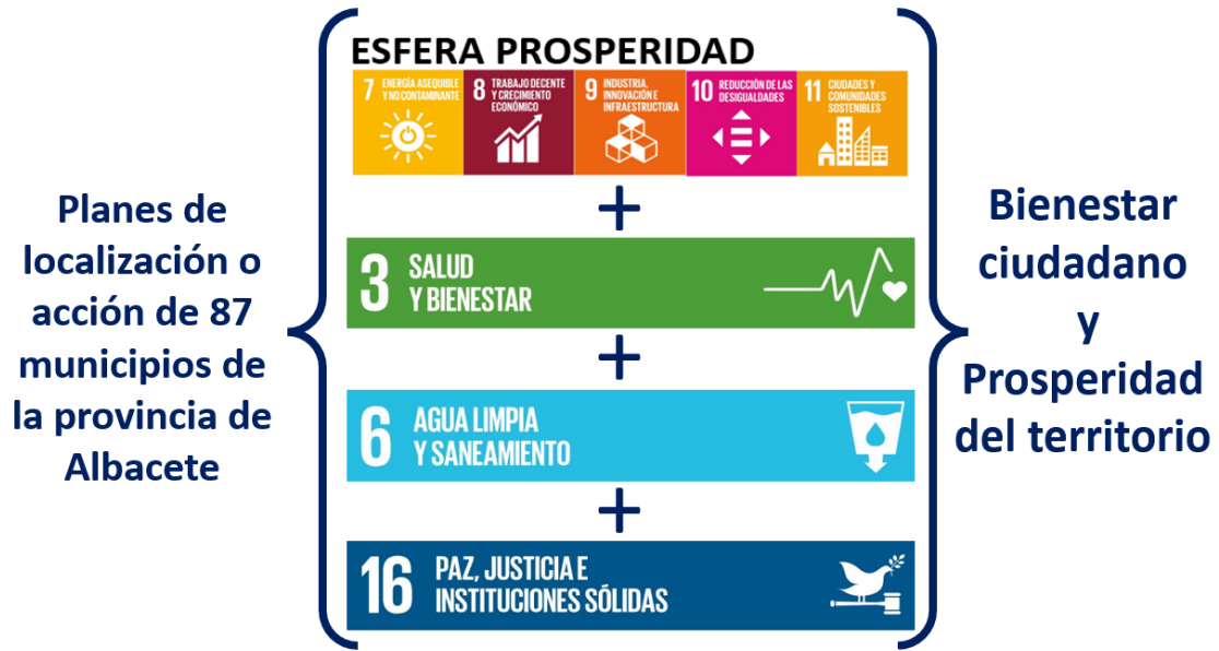
Figura 3. Esquema metodología a aplicar en el estudio (Elaboración propia, 2024).