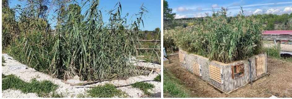
Figura 2. Imágenes de los humedales demostrativos construidos en la EDAR de Carrícola. Humedal de flujo subsuperficial vertical 1 (izq.) y 2 (dcha.) conectados en serie, ambos con fango de ETAP.

El primer humedal funcionó de manera continua durante los primeros meses, encontrándose el medio poroso saturado de agua de manera continua, y posteriormente funcionó de manera secuencial, mediante llenados y vaciados parciales, mediante aperturas programadas de una electroválvula. A partir del segundo año, se puso en marcha el segundo humedal, que ha funcionado en modo secuencial desde su inicio. En el primero se plantaron Iris pseudacorus , Narcissus spp. y Juncus subnodulosus (1 planta/2 m 2 ). En el segundo se plantó Phragmites australis (1 planta/m 2 ).