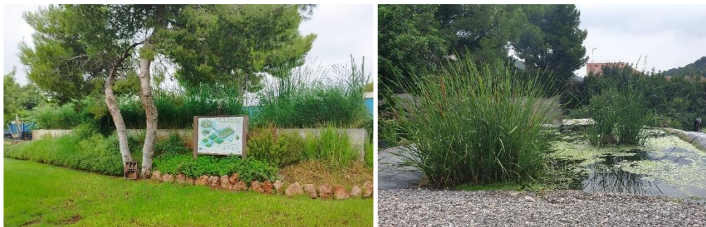
Figura 3. Imágenes de los humedales demostrativos construidos en la EDAR de Los Monasterios. Humedal de flujo subsuperficial vertical con fango de ETAP (izq.) y humedal de flujo superficial (dcha.)

La EDAR de la Urbanización de Los Monasterios es un ejemplo de gestión social de los recursos hídricos ya que los propios vecinos son propietarios de la EDAR y se encargan de su gestión. Esta EDAR recoge el agua residual de una comunidad de unos 1000 habitantes equivalentes cuyo efluente, entre 100-120 m 3 /d, es empleado para usos urbanos como el riego de zonas verdes y fuentes urbanas ornamentales.