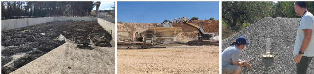
Figura 1. Imágenes del proceso de acondicionamiento del fango: secado al aire (izq.), molturado y clasificado (centro), aspecto final del fango granulado (dcha.).

El acondicionamiento del fango ha consistido en una deshidratación mediante centrífuga y posterior secado natural al aire libre, hasta alcanzar una humedad de entre un 10 y un 20%. Para ello, el fango se extendió en pilas que fueron periódicamente volteadas. Posteriormente, se transportó a una cantera cercana, donde se molturó mediante un molino de impacto y una tamizadora portátil. La granulometría obtenida varió entre partículas menores de 0.08 mm y 20 mm (Figura 1).